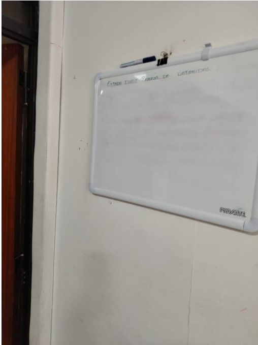
Foto: Instalación de pizarra