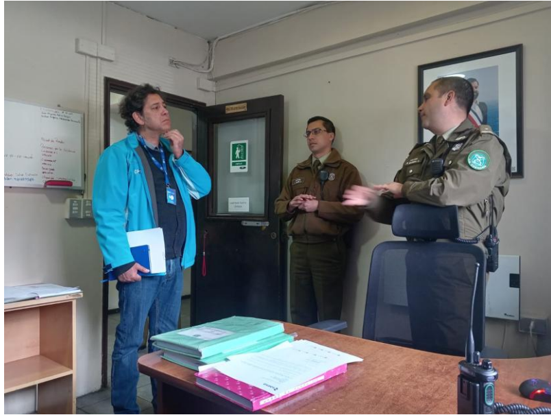
Foto: Revisión de Pizarra en la Guardia y Los Libros de Registro