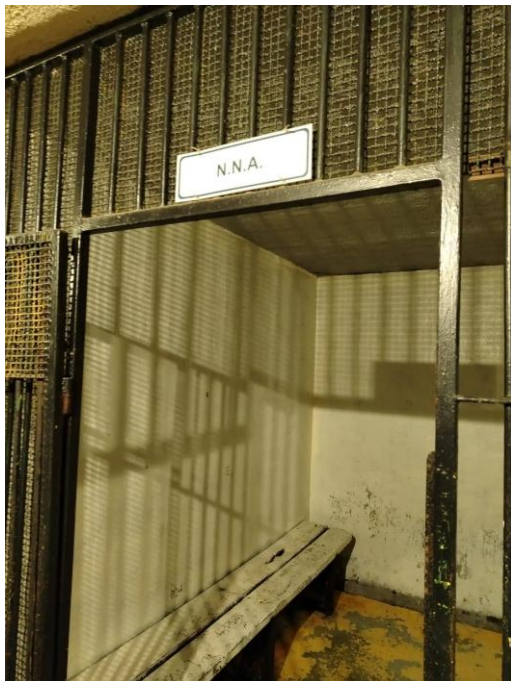
Foto: Celda para Adolescentes