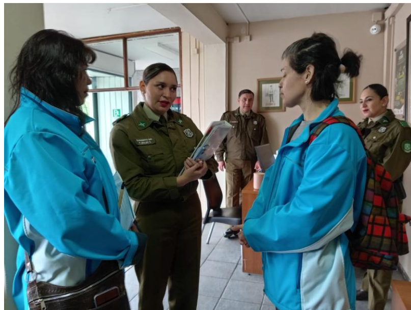
Foto: Recorrido por la Comisaría.