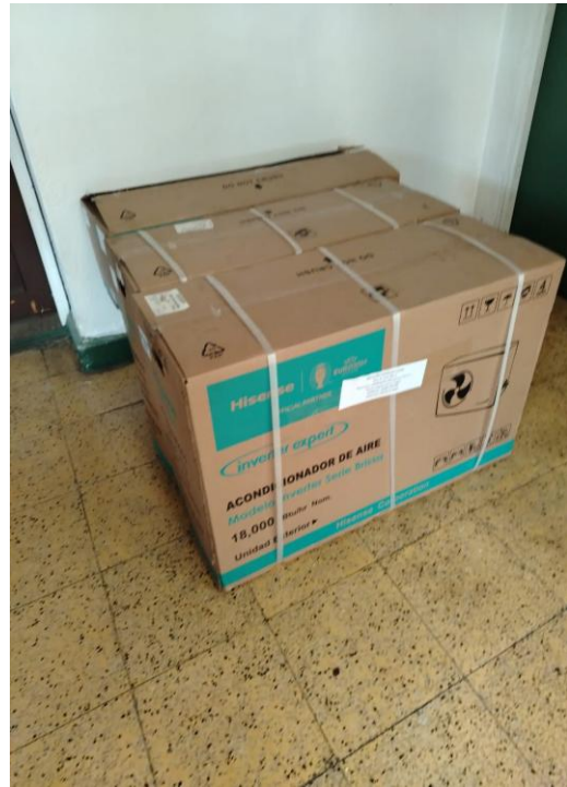
Foto: Aire acondicionado comprado, sin instalar