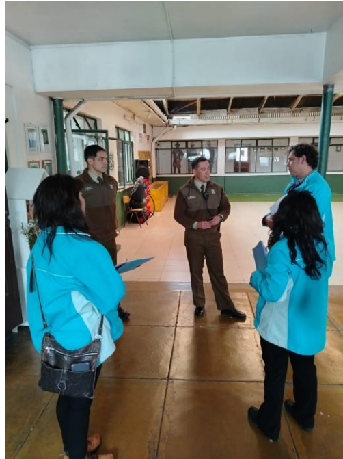
Foto: Recorrido del Equipo en la Unidad