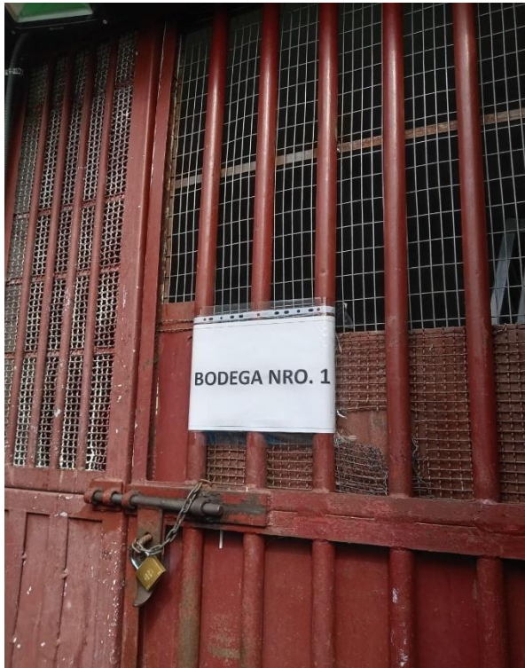
Foto: Celda clausurada