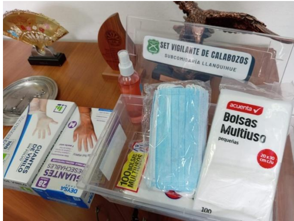
Foto: Insumos entregados por la Sección de DDHH